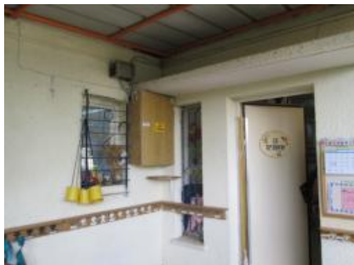
תמונה 2 : אולם הגן